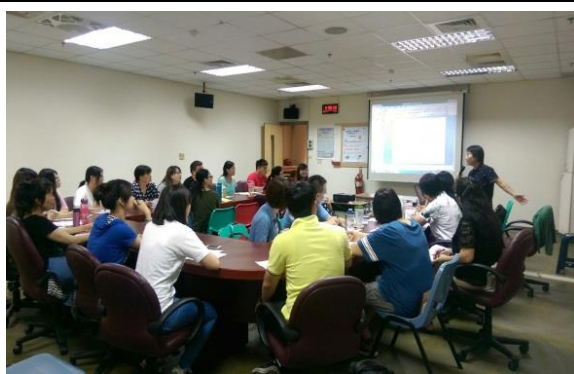
個案研討~大家為了特殊身障家庭共同服務方向。