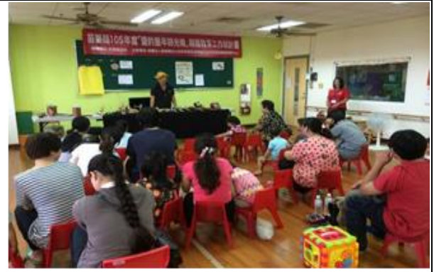
105 年度『愛的童年時光機』親職教育工作坊