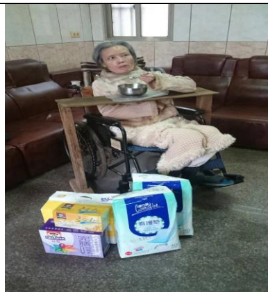
社工連結物資給弱勢身障家庭(二)