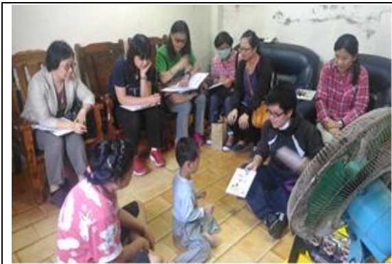
到宅專業團隊評估