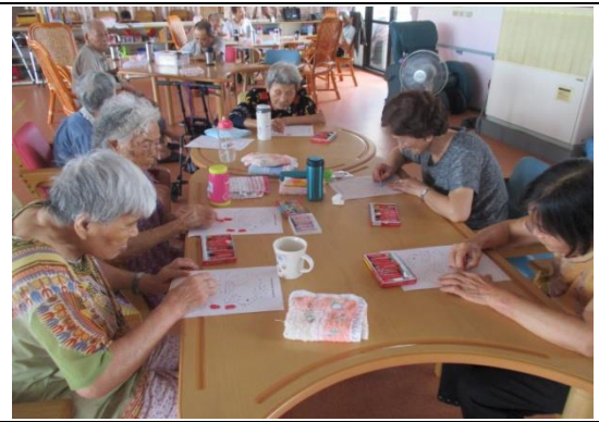
長輩進行藝術課程