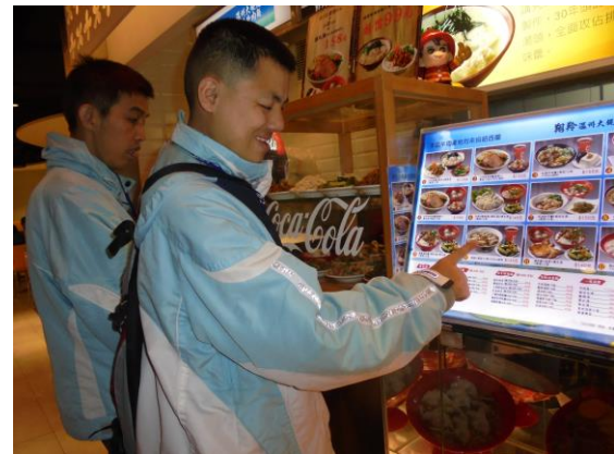
社區適應-選擇午餐