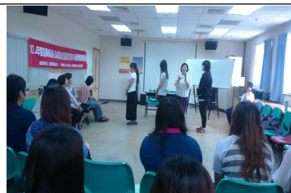
教育訓練-提升助人工作者之專業知能。