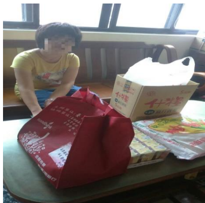
社工連結物資給弱勢身障家庭(一)