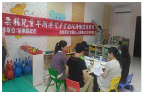
專團療育整合建議