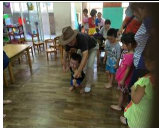
古早味代表~木製小陀螺