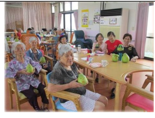
進行年節節慶活動