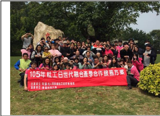
與育達科技大學進行產學合作