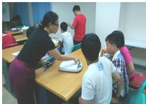
身障生活自理成長課程~教導正確使用電器。