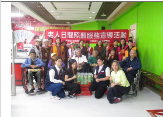
家屬支持暨宣導活動