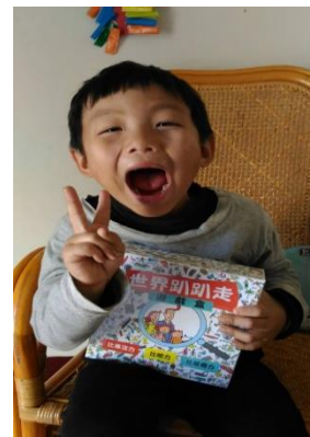
資源連結-YA!謝謝善心叔叔阿姨的聖誕禮物!