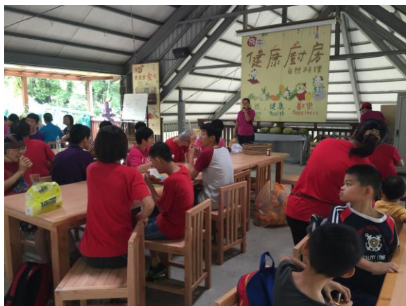
親子旅遊-飛牛牧場