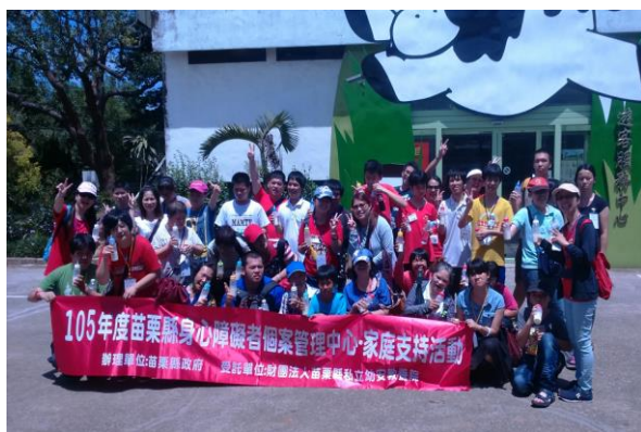
家庭支持活動，讓參與者喘息與學習。