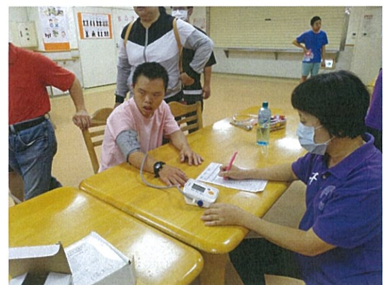
服務對象健康檢查