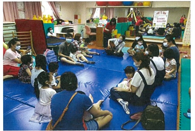
主題團體活動-親子音樂律動