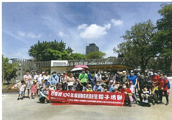
親子戶外活動-新竹動物園