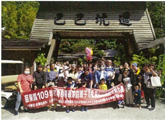
親子活動-巴巴坑道