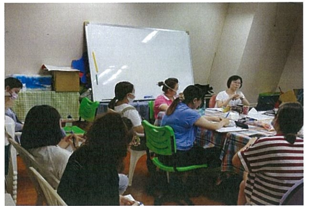
外聘督導、個案研討