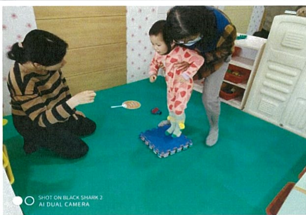
專團評估-療育諮詢