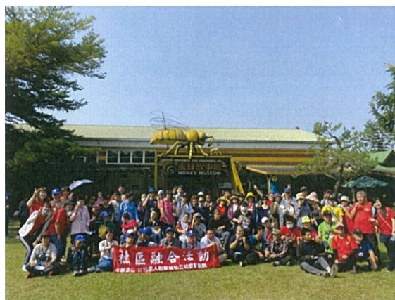
親子活動-雲林一日遊