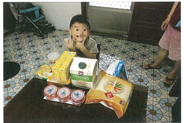
物資媒合-食物銀行