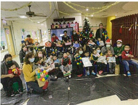
聖誕活動-聖誕運動會