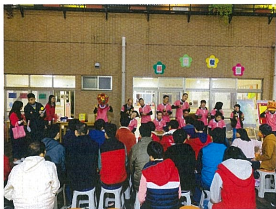
服務對象暮年餐會