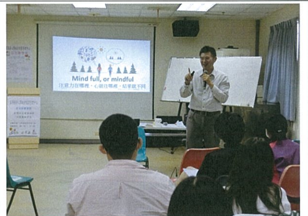
教育訓練 如何運用正念減壓於助人工作者