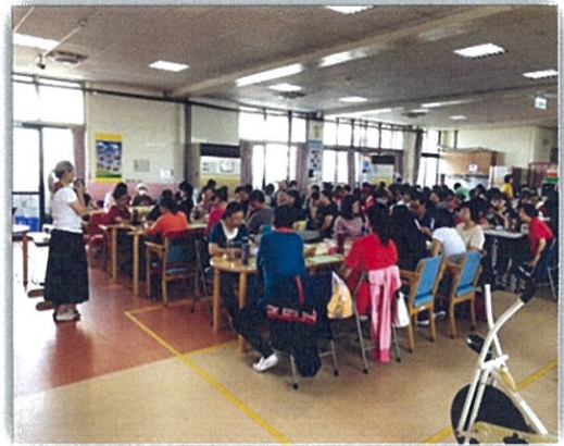
團體督導會議暨在職訓練