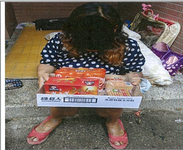
連結物資給弱勢身障家庭(一)