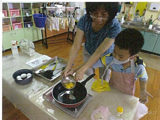
課程名稱-小小美食家 (單元課)