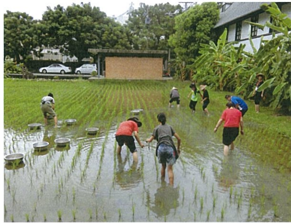
家庭支持活動 苑裡有機稻場