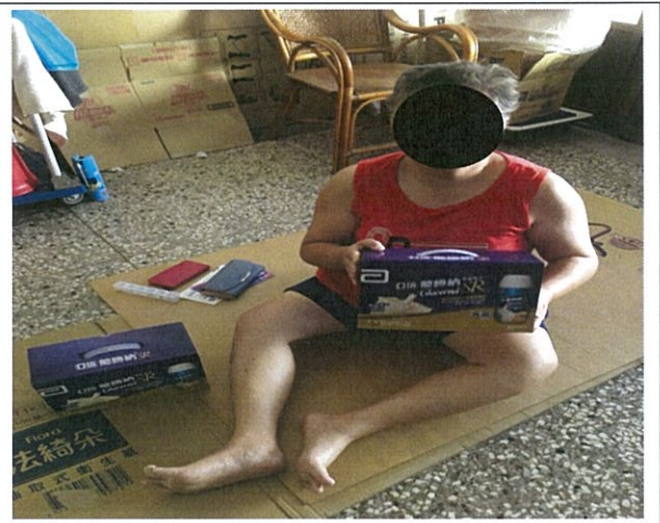
連結物資給弱勢身障家庭(二)