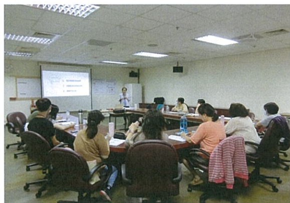
個案研討 情感需求高身障者之服務方式