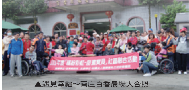
▲遇見幸福~南庄百香農場大合照