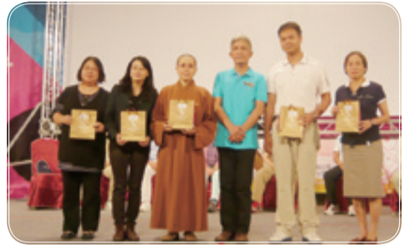
▲兆豐捐贈家樂福禮券

本院林院長於101.5.5至西湖度假村受贈禮券，並提及本院服務對象中有33%為低收入戶，其教養費用由政府全額補助。尚有40%身心障礙家庭未符合低收入戶資格，且家庭經濟狀況不佳，以致於無法負擔教養費用以及日常生活所需費用。所以，非常感謝兆豐慈善基金會的協助，用小手溢注了更多力量，讓這群身心障礙朋友多了份笑容，並減輕了貧困身心障礙家庭雙重負擔!