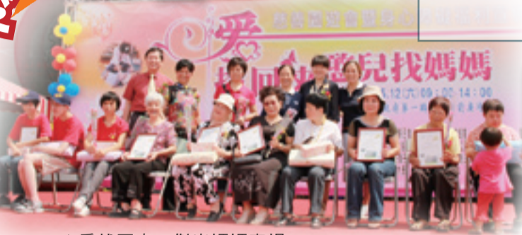
▲愛找回來～傑出媽媽表揚

本院於5月12日舉辦「愛找回來 憨兒找媽媽」慈善園遊會暨身心障礙福利宣導活動，活動當日約2千5百人一同共襄盛舉。除表揚贊助人，此次活動也特別針對7名傑出媽媽進行表揚，讓身心障礙朋友與媽媽們歡度難忘的母親節。