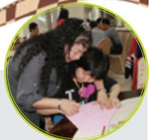
▲小芸與媽咪一同畫作風箏的雛型