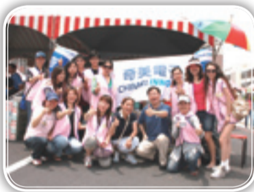
▲奇美電子熱情參與園遊會活動

感恩、感謝對幼安伸出雙手的每一個人，你們手心的溫度，讓幼安這一群身障朋友們倍感溫暖。當然，也讓他們能夠恣意地往前邁進、迎向希望！這一份情緣，我們將會鎖進記憶的寶盒裡，並帶領這群身障朋友們，完成更多更多的夢想！