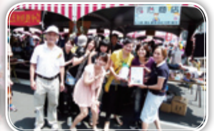
▲感謝各設攤單位踴躍參與園遊會活動

幼安每年服務案量平均超過一千多名身心障礙者及其家庭，在邁向第19個年頭裡，我們仍一本初衷以專業熱忱提供服務。近期