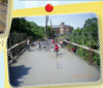
▲慈兒家園二樓樓地板施工情形(二)

親子同樂，工作讓他們得以改善家裡經濟狀況及增加自信心，對於家的期待漸漸可以圓夢，以自己的力量生活於社區中，期許有更多的資源挹注在『社區家園』，許一個、兩個...更多家的成立。