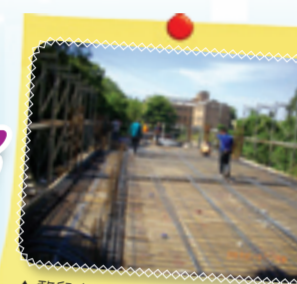
▲慈兒家園二樓樓地板施工情形(一)

關於家的願望，對他們來說遙不可及，不敢做夢讓自己夢想成真，但經過社區家園的服務，讓他們順利找到工作機會，平時下班可以在市區裡居住，假日返家享受