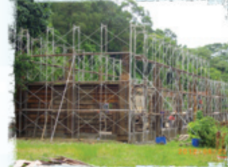
▲慈兒家園一樓施工情形

一塊愛心磚，共同拼湊一個家，感謝各界善心人士、企業捐助，我們的家漸漸地看見曙光。身障老慈兒家園興建期程規劃為，第一期工程：一、二樓主體建築物興建，第二期工程：內部空間及水電規劃，第三期工程：主體建築物內外裝修完工；目前進度為一、二樓主體建築物興建完成，待進行第二期工程。