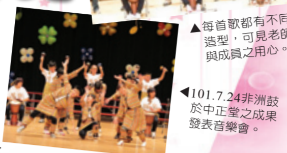
▲每首歌都有不同造型，可見老師與成員之用心。

幼安非洲鼓今年度透過苗栗縣政府、台新銀行公益慈善基金會、中油、台電公司的補助，才能持續讓這群身心障礙者練習非洲鼓，後續仍然需要各界的協助，讓身障者可以繼續接觸音樂，有更多揮灑的舞台，帶給大家更多的歡樂與感動。