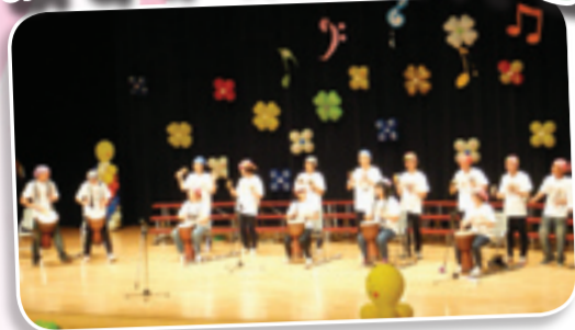
▲演出機會增強了這群身障者的自信心！

101年7月24日這天，夏夜晚風悠悠，幼安教養院和師大合唱團及建功國小合唱團共同辦理的音樂會在苗栗中正堂正式演出。