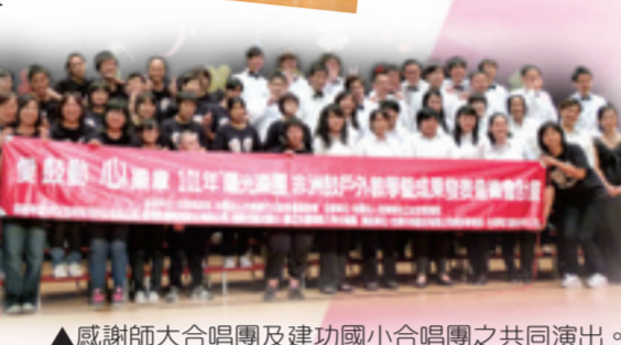
▲感謝師大合唱團及建功國小合唱團之共同演出。