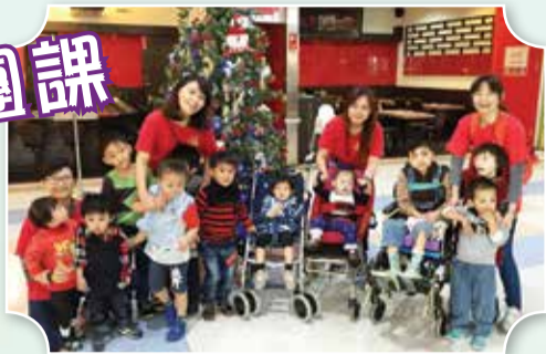
▲早療寶貝們外出走走郊遊去

~走走走走走~我們一起去郊遊，配合期末單元活動嘉年華社區適應，於是在11月底即計劃讓幼安日照的小朋友們至頭份尚順育樂中心及廣場附近感受聖誕節