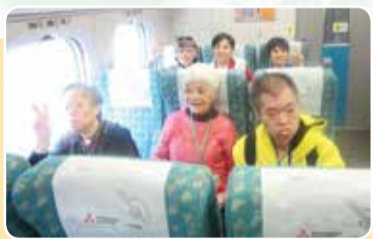
▲高鐵初體驗-大家都充滿期待

進入高鐵車站的那天，孩子們的眼神中流露出既驚喜又讚嘆的小星星，第一次看見高鐵是如此的喜悅呢！孩子們井然有序的排著隊伍依序上了車，靜靜的坐在車箱裏，眼神四處遊移，彷彿進入了大觀園般無數的驚奇，高速的奔馳恰如孩子們內心澎湃的波濤洶湧。