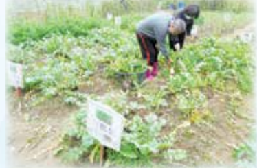
▲這是我負責照顧的區域！！我的蔬菜長的又大又漂亮

經過半年的耕耘，這塊園地生意盎然，充滿著服務對象的歡笑，每天到園地時，先走到自己的認養區塊，看著菜圃中小小的菜苗逐漸成長茁壯，服務對象臉上露出笑容，這是他們辛苦的成果。