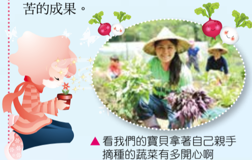
▲看我們的寶貝拿著自己親手摘種的蔬菜有多開心啊

總之，汗水的背後，所種出的成果，代表著服務對象的用心，看著目前井然有序的園地，心裡想著我願意與這些服務對象共同努力下去。