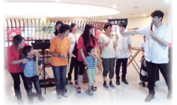
▲欣賞竹樂之餘，也讓小寶貝們上台體驗竹樂器

新奇的樂器、美妙的天籟之聲，尤其竹樂器特別的音頻，讓幼安小寶貝們目不轉睛，臉上洋溢著純真笑容。悅耳的樂聲不但刺激幼兒感官享受，也體驗到不同的樂器使用方式。其實0~6歲的小寶貝具有認知學習、語言溝通、粗細動作、人際互動等能力，竹樂器演奏同時大家都非常起勁，一起拍著手搖擺身體，讓人感受到音樂的無窮魅力。