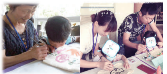
▲苗栗縣106年度親子共學暨社區融合活動剪影