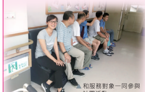
▲和服務對象一同參與社團活動

就像幼安的烏龜logo一樣：「即使他很慢，但我們有信心！」相信只要有機會，他們也能完成許多事情。來到幼安這個大家庭一個多月了，期許自己能盡更多心力為這些孩子服務，並與他們共同努力下去！