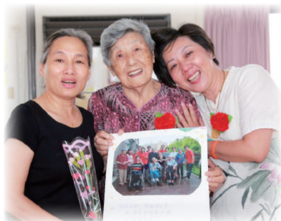
▲竹南日照中心慶祝母親節活動