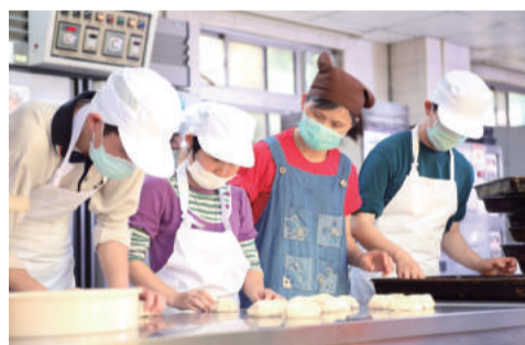
▲小心仔細完成的月餅，期待您能嘗到這份溫暖。

幼安成長的歡喜天使們比任何人的學習都來的辛苦，在充滿關愛與安定的環境下，每項手作產品都是天使們用雙手一個動作、一個步驟小心仔細地完成，期待這份溫暖能傳遞到您心中。