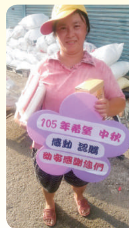
▲去年幼安將募得月餅，轉送至弱勢家庭，一起享受中秋的溫暖。