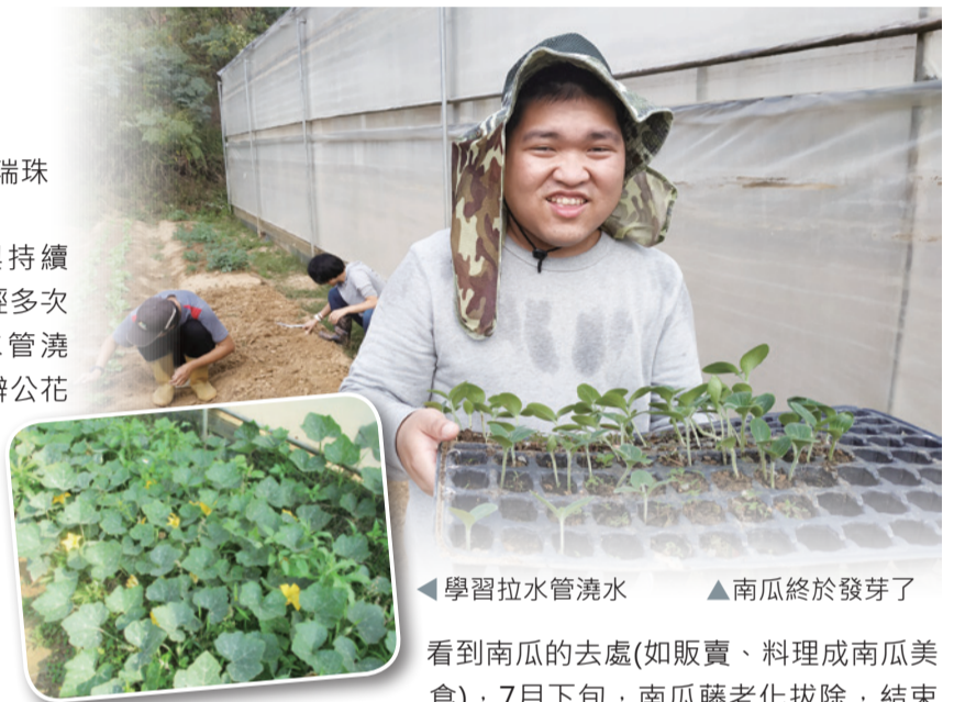
◀ 學習拉水管澆水 ▲ 南瓜終於發芽了

今年6月，南瓜果實陸續成熟了，因疫情停課期，多半服務對象無法親自採收成果，老師們透過影片遠距教學，讓在家的學員們也能