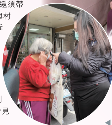
◀ 想办法讓阿英上車