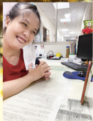
▲ 看到電話裡的媽媽笑得 好開心

電話：037-366995 傳真：037-366885 電話：037-338180 傳真：037-338160 電話：037-688955 電話：037-551775 電話：037-680056 電話：037-260820 傳真：037-260590 電話：037-268995 傳真：037-262627 電話：037-765322 電話：037-760195