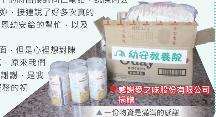
♥ 感謝愛之味股份有限公司捐贈

雖然那天沒有見到面，但是心裡想對陳阿公說個十萬次不客氣，原來我們是這麼需要服務對象的謝謝，是我們努力的動力，也是服務的初衷！