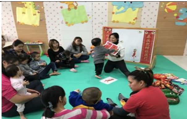
親子繪本團課-愛搗蛋的年獸