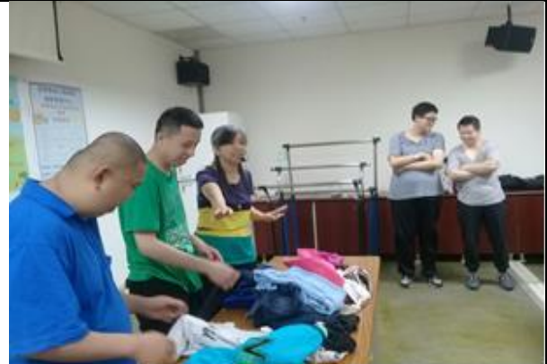
身障生活自理成長課程~實地教導學員進行衣物分類與整理。