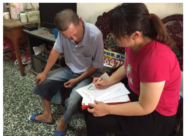
實地訪視案主需求