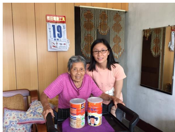
資源再造-物資轉贈