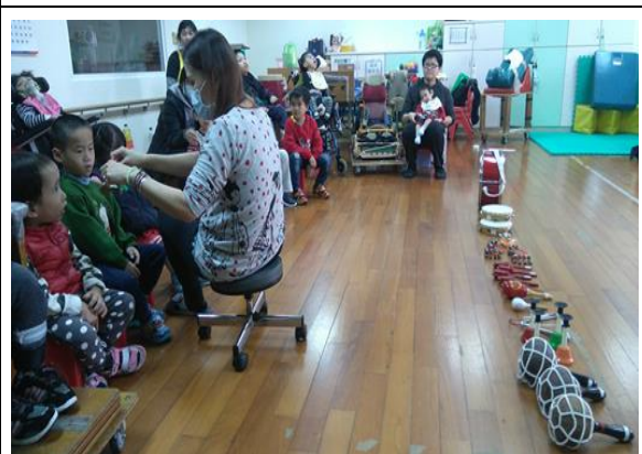
課程名稱-聲音好好玩