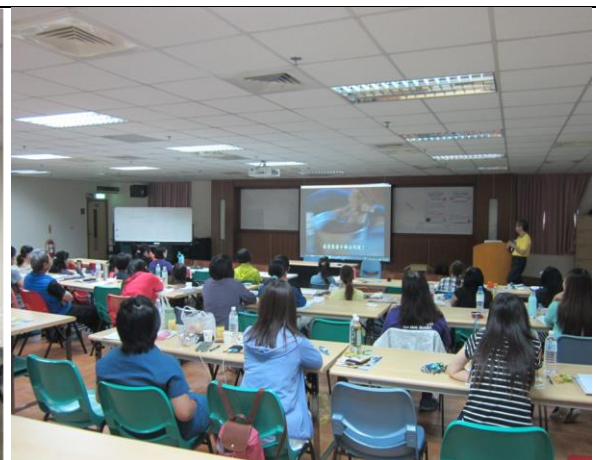
教育訓練-提升助人工作者之專業知能。