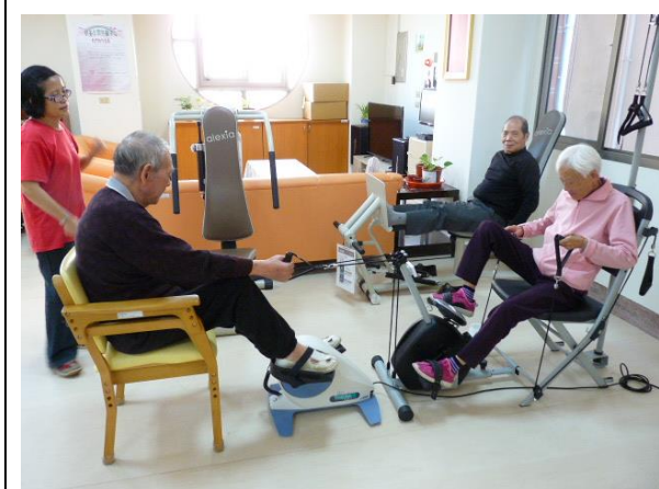
健身器材使用狀況