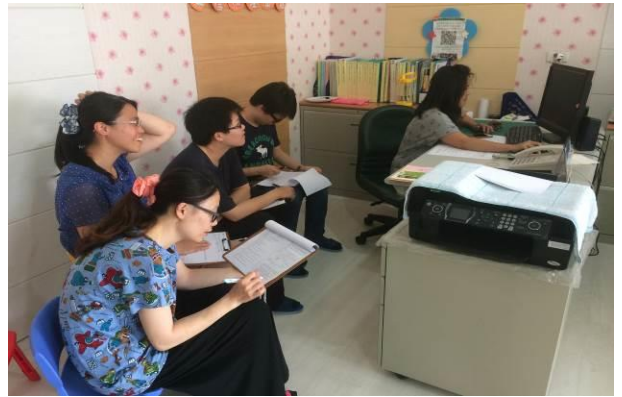
專團療育整合建議