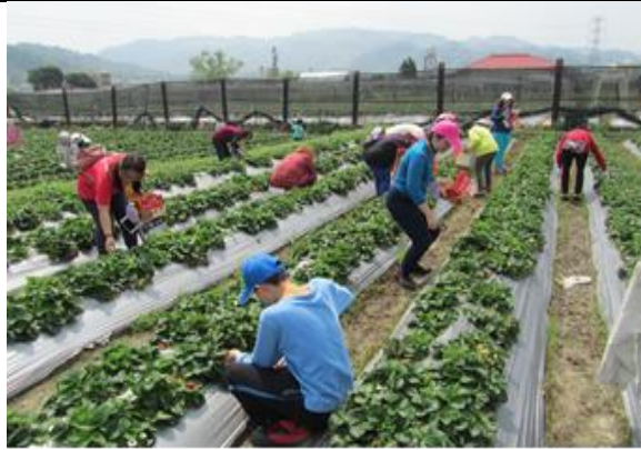
家庭支持活動，讓參與者喘息與學習。