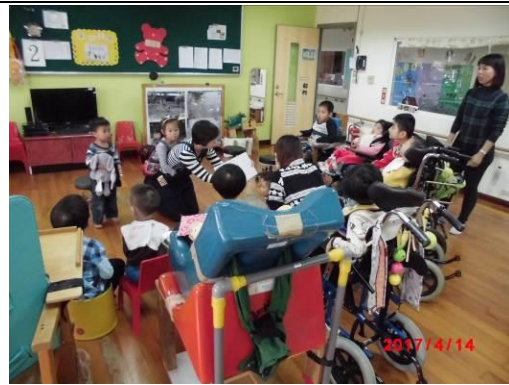
資源連結-社區媽媽說故事