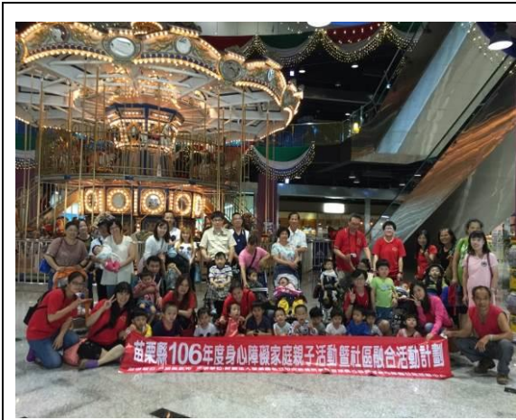
親子活動-尚順娛樂廣場