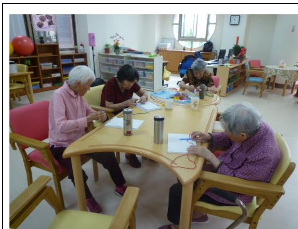
連線板作畫-豐富長者想像力