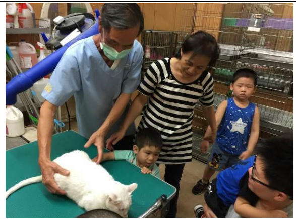
社區適應-犬昌動物醫院