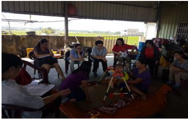
到宅專業團隊評估