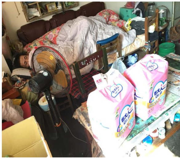
社工連結物資給弱勢身障家庭(一)