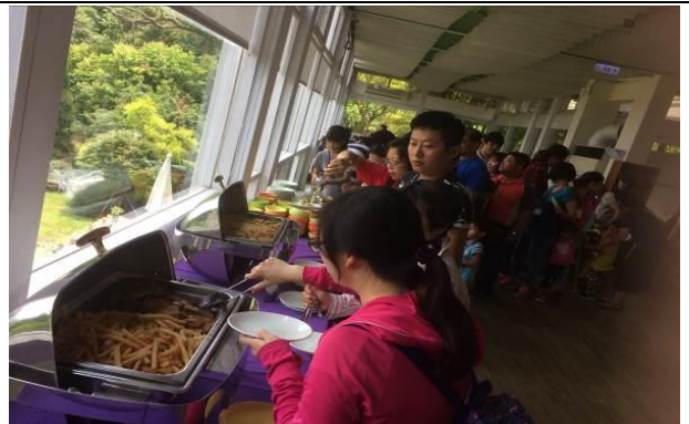
薰衣草森林饗食時光