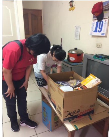
社工連結物資給弱勢身障家庭(二)