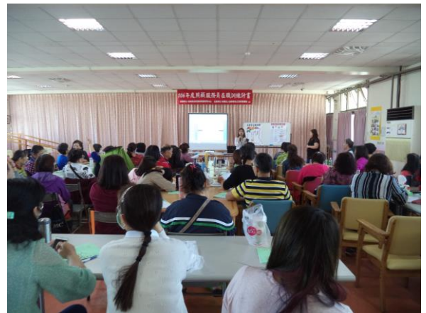
在職訓練-提升專業知能