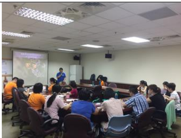
個案研討~大家為了特殊身障家庭共同服務方向。