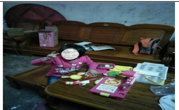
資源連結-聯發科技聖誕禮物